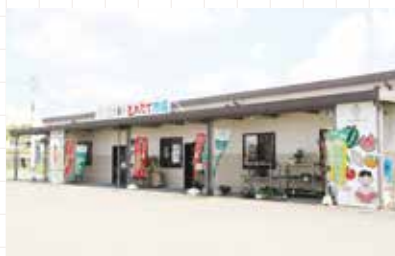
とれたて市場益城店