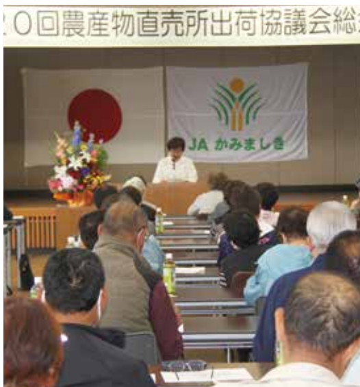
農産物直売所出荷協議会総会様子