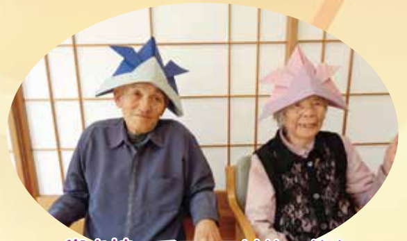
兜を被ってニッコリ(△▽^)/