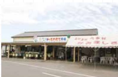
とれたて市場嘉島店