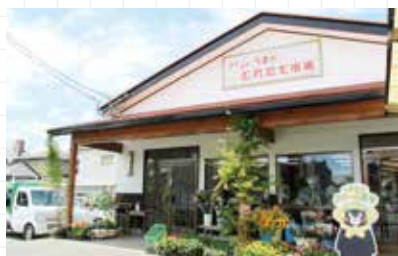
とれたて市場花立店