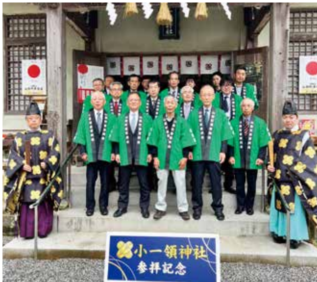
小一領神社にて集合写真

立春から数えて八十八夜の5月1日（水）、山都町の小一領神社で献茶祭を行いました。行政やJA関係者が参加し、本年産の質の高い茶の収穫を祈願しました。