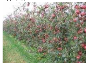
収量慣行比1.7倍以上