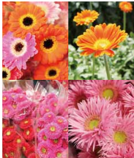
全部ガーベラです

毎年どんどん新しい品種が出るので生産者仲間と試作圃場(開発したメーカーごとに、新品種が一齐に植えてある畑)を見学したりして積極的に新しい花を取り入れています。ガーベラ