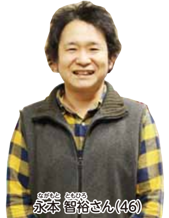
御船町の花卉農家。家業を継ぎ農業の道に進んで13年、3世代7人でガーベラやトルコギキョウなどの花卉、スイートコーン、米麦を栽培。

は55アール、トルコギキョウ35アール、スイートコーン30アール、米4ヘクタール、麦3ヘクタールを両親、私たち夫婦、子どもたちの7人で育てています。