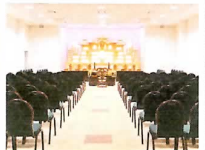
天昇院みふね 全景