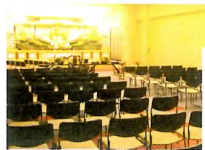
天昇院ましき 大ホール全景

詳しい内容及び、お葬式に関する質問・その他 お聞きになりたい事がございましたら、 お気軽に天昇院スタッフにお尋ね下さい。 親切・丁寧にアドバイス致します。