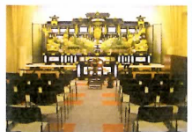
天昇院ましき 小ホール全景