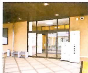
天昇院みふね 玄関ポーチ