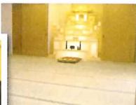
天昇院ましき 通夜室(21畳)