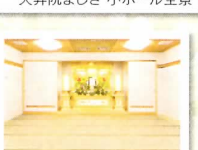
天昇院みふね 遺族控え室